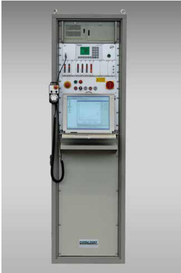
Abbildung zeigt Antriebsstation AS-C-20 N-PC (Option)