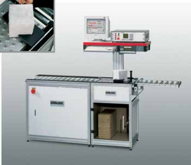
Abbildung zeigt Antriebsstation MEWIS-C20-PC