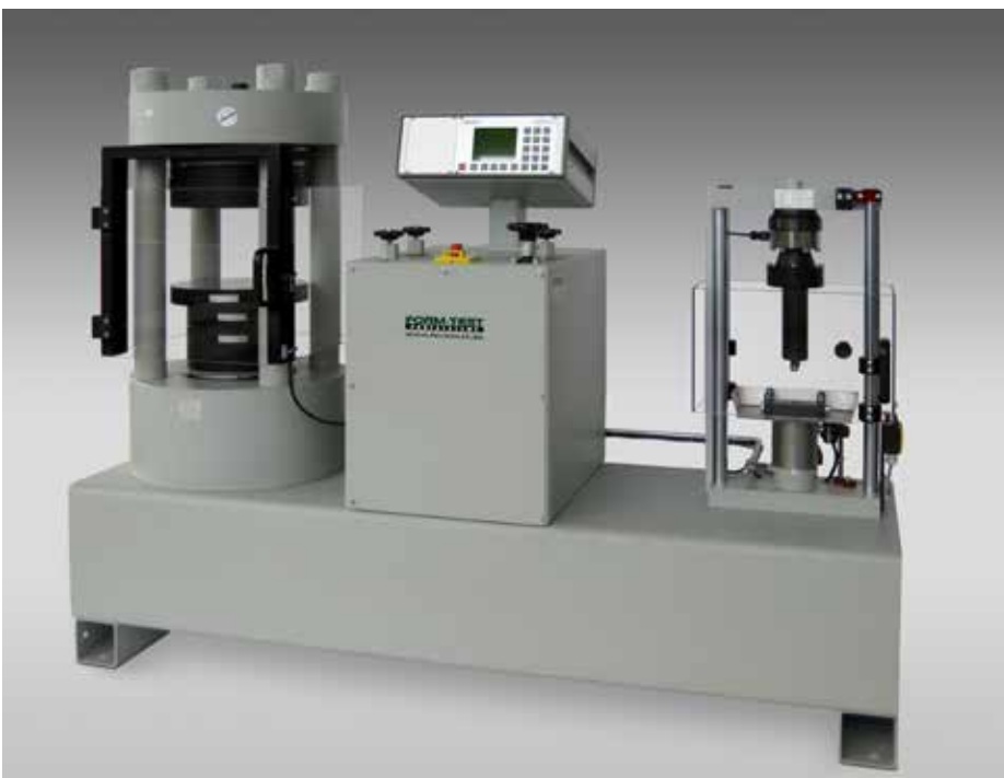
Sonderausführung mit Biegeprüfung für Prismen (Zement/Mörtel)