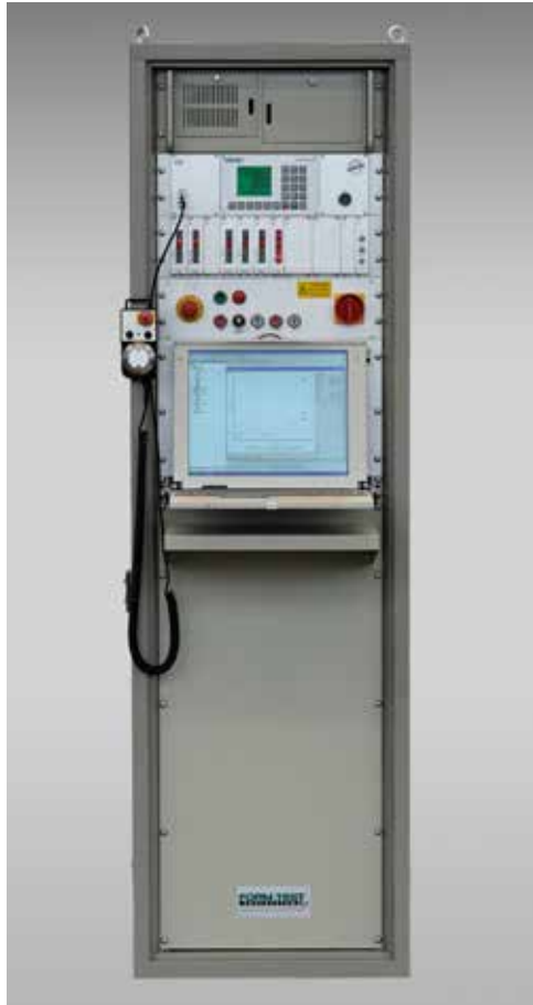
Abbildung zeigt Antriebsstation AS-C-20 N-PC (Option)