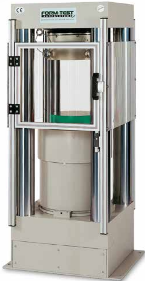
Abbildung zeigt Prüfmaschinenrahmen mit verchromten Maschinensäulen (Option)